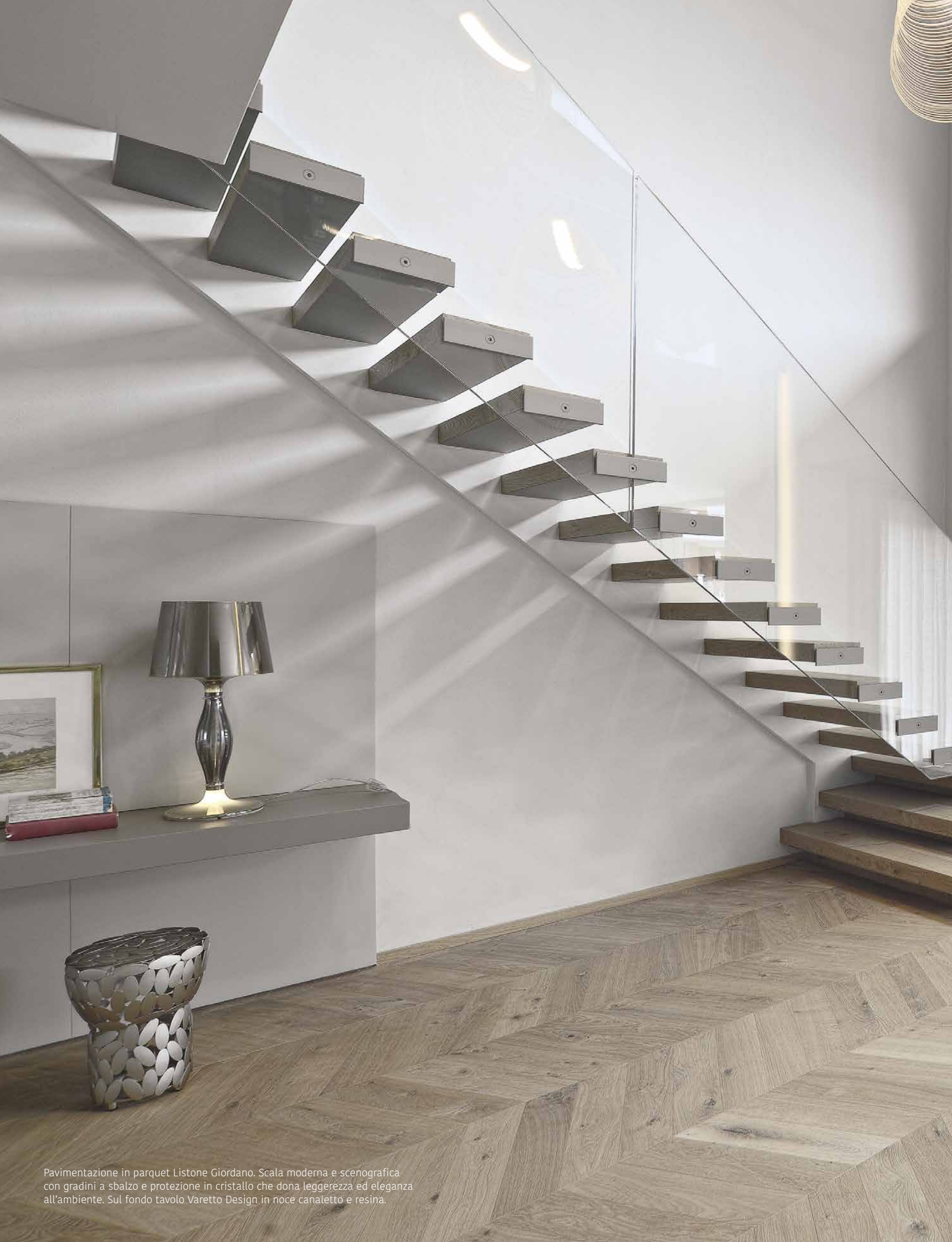
Pavimentazione in parquet Listone Giordano. Scala moderna e scenografica con gradini a sbalzo e protezione in cristallo che dona leggerezza ed eleganza all'ambiente. Sul fondo tavolo Varetto Design in noce canaletto e resina.