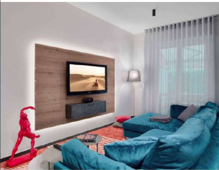
Nota di calore e di calore per il salotto con il divano Zeno di Bibo Salotti, in velluto No, Bobette lignea rivestita in lino per definire la tv.