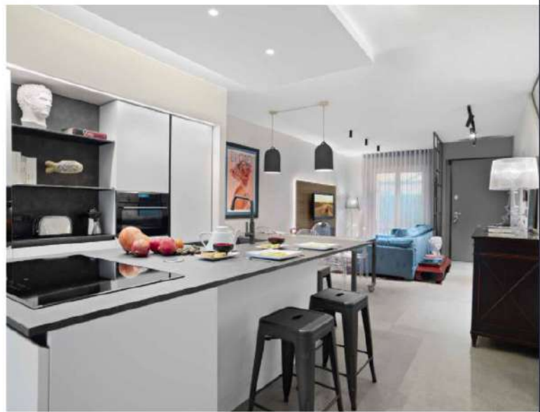
Moderna e lineare la cucina K&A, Arredo3, in materiale Fenix di colore bianco con piano lavoro in laminato HPL, grigio effetto pietra, materiali di ottima resistenza e funzionalità, resistenti a graffi, urti e abrasioni.